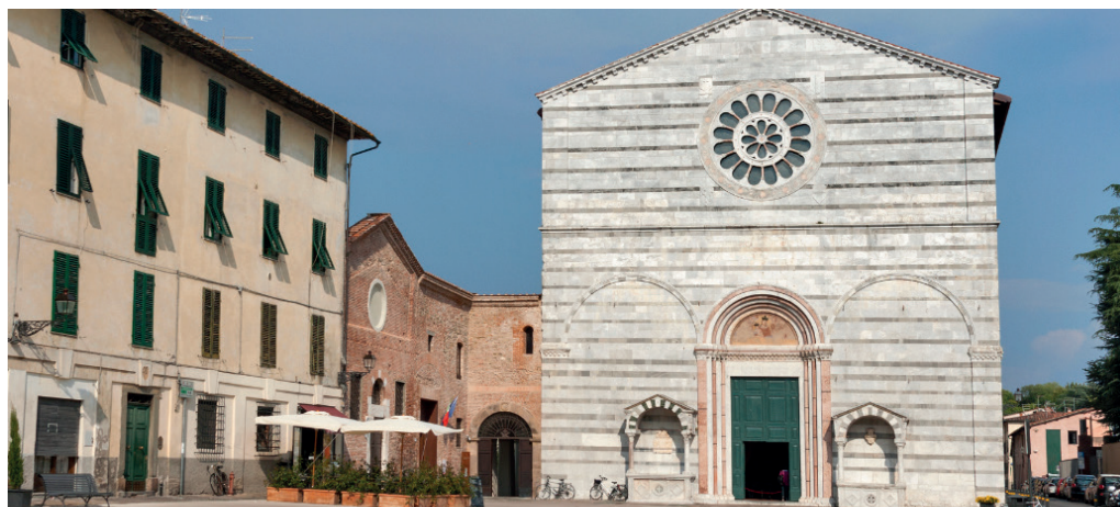
Chiesa di San Francesco

Proseguendo nel centro storico della città di Lucca, incontriamo uno dei suoi complessi monumentali più belli e prestigiosi, il Real Collegio , sede dell'antico convento della basilica di San Frediano e location della Cena di Gala, che avrà luogo la sera del primo giorno del convegno.