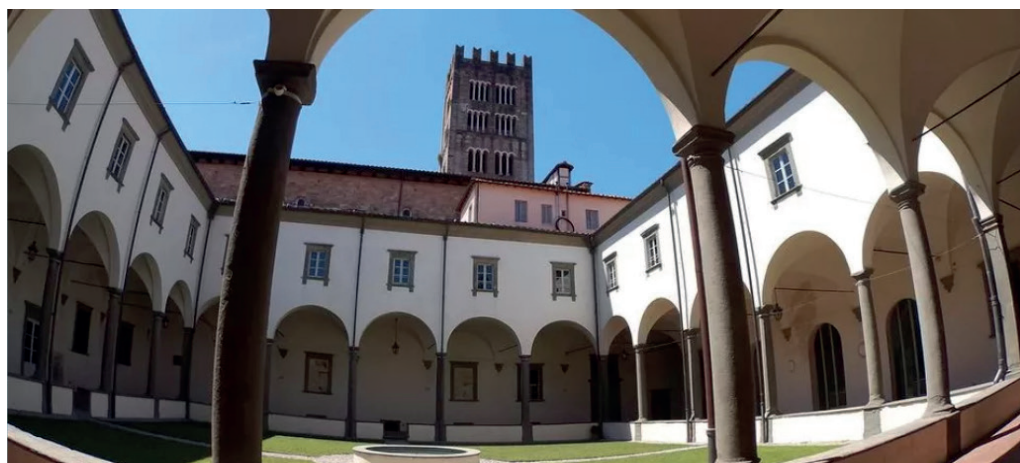
Chiostro Real Collegio